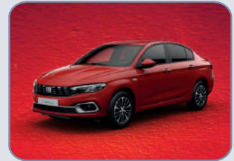
PASSIONE RED (6YI-3G3)