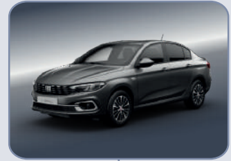
UNDERGROUND GREY (5DR-Gr5)