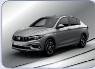
MAESTRO GREY (5DQ-G1Z)