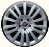
ENTRY 15" STEEL