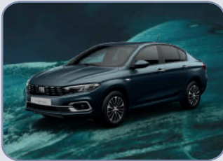
OCEANO BLUE (6FW-PO5)