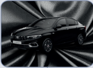
BLACK CINEMA (5CD-713)