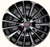
17" ALLOYS 3PP (STYLE PACK)