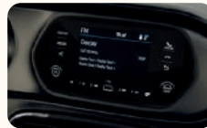
J5 10" COLOR BT (NO TOUCH)