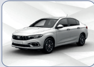
GELATO WHITE (5CA-Z?r)