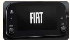
VP7 2" (TSCHNO PUCM)